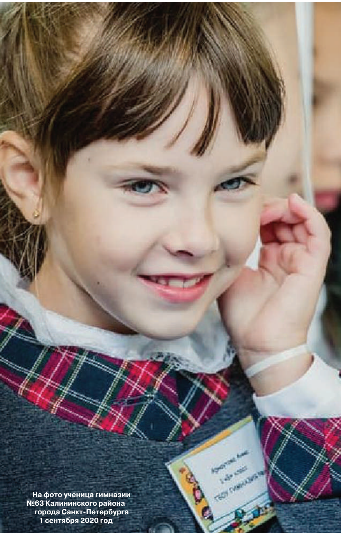
На фото ученица гимназии №63 Калининского района города Санкт-Петербурга 1 сентября 2020 год